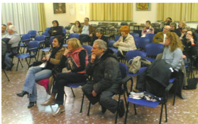
I soci seguono lo scrutinio delle schede

Venerdì 11 Aprile 2008 si sono svolte le elezioni per il rinnovo del Consiglio Direttivo della nostra Associazione e dei Sindaci Revisori. Nel salone della Misericordia all'uopo prenotato hanno partecipato alla votazione 51 soci (circa il 50%) in regola col versamento della quota sociale annuale. Dopo l'ora a disposizione per chi voleva votare si è proceduto alla chiusura dell'urna e allo scrutinio scheda per scheda leggendo ad uno ad uno i nomi scritti sulle schede. Ogni socio poteva esprimere fino a 9 nominativi per il Consiglio Direttivo (scegliendo fra 12 aspiranti candidati consiglieri) e 3 Sindaci Revisori (scegliendo fra 5 aspiranti candidati sindaci).