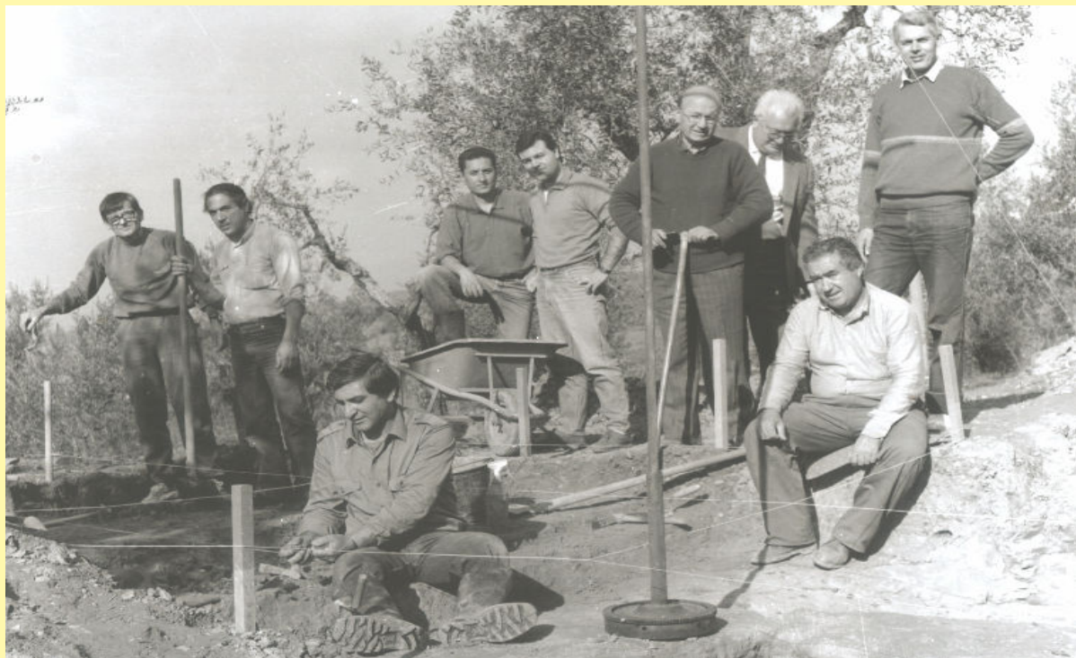
Alcuni soci della nostra Associazione nei primi anni '80 nelle campagne di Martignana durante alcuni scavi sui resti di alcune tombe etrusche