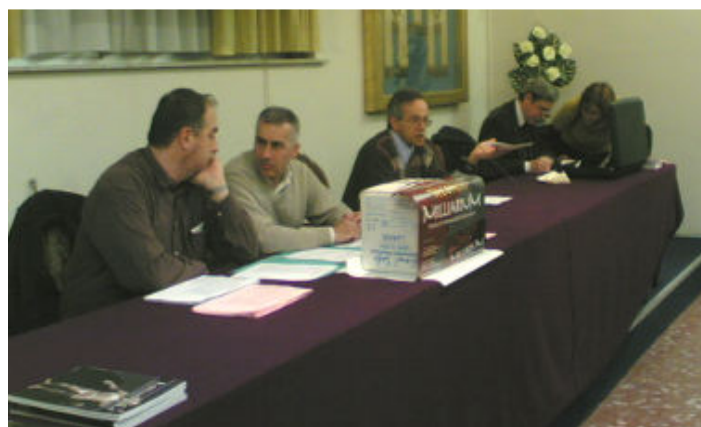
La "Commissione Elettorale" si consulta